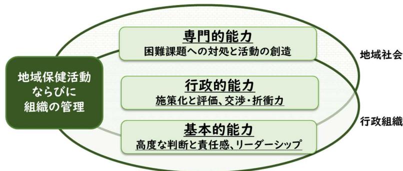
図1 地域保健活動実践能力の構造(管理者)